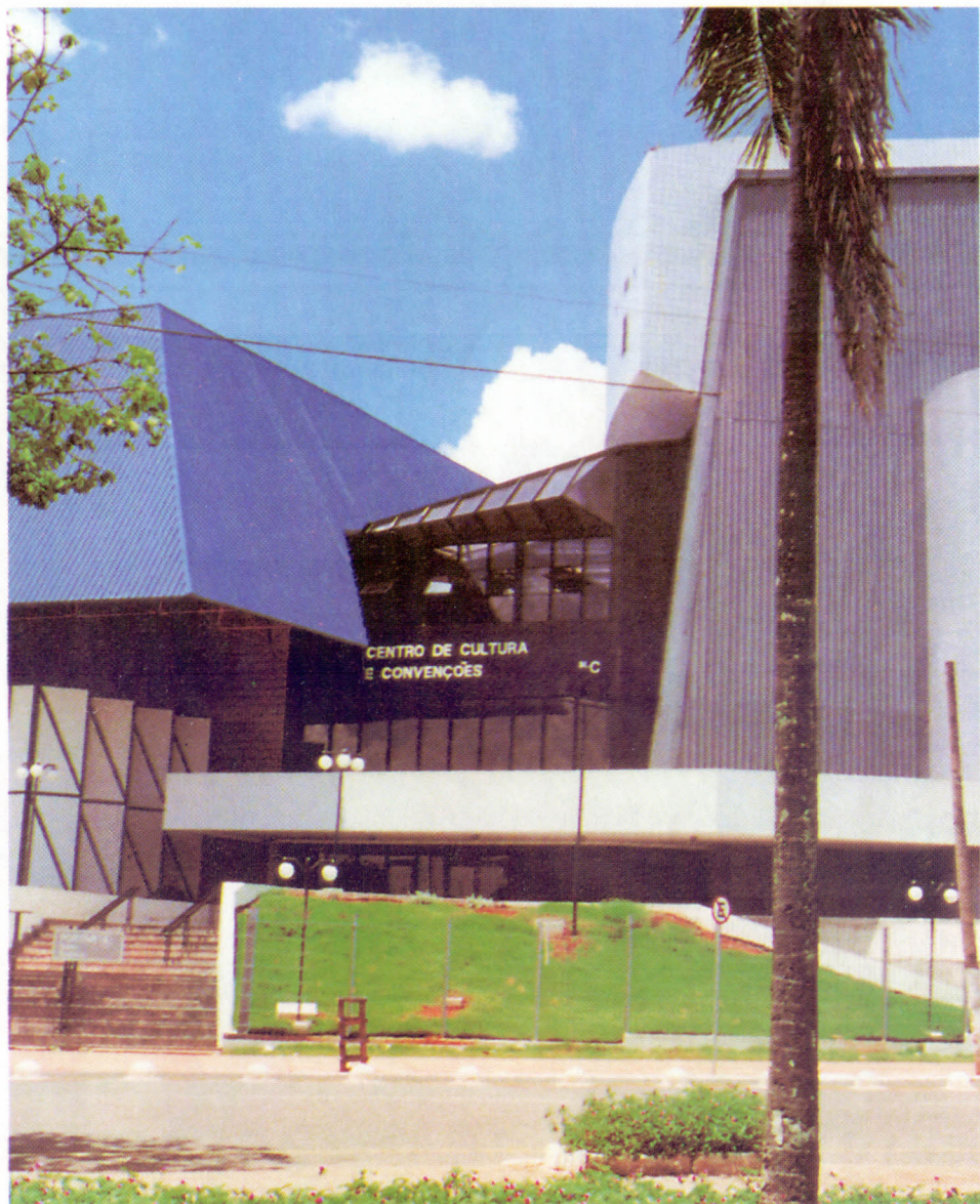
Centro de Cultura e Convenções de Goiânia Rua 4 esq. C/ 30 Setor Central