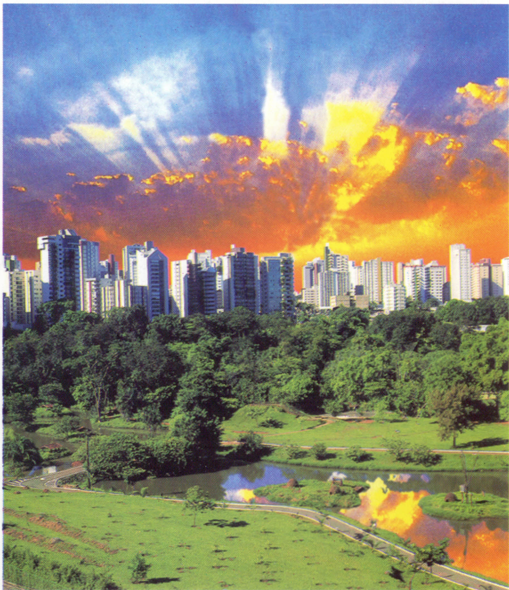
Condições ambientais em Goiânia - Temperatura média de 27° a 33° C. Energia elétrica na potência de 220 volts.