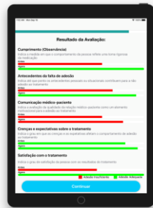
Figura 2 - Resultado do Perfil de adesão no aplicativo.