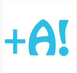
Figura 4 - Icone.