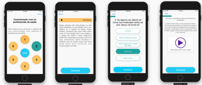
Figura 5 - Telas do aplicativo.