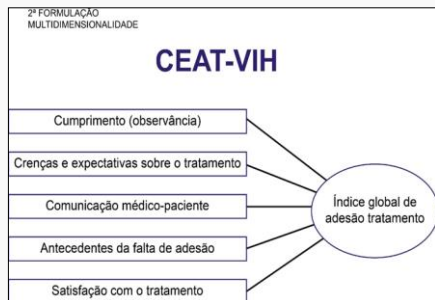
Figura 1 - Estrutura dimensional do CEAT-VIH.

A adesão à terapia antirretroviral apresenta-se como um problema de saúde pública, apesar da disponibilidade e gratuidade deste conjunto de medicamentos no Sistema Único de Saúde. Considerando a disseminação e evidências de intervenções baseadas em aplicativo em distintos problemas de saúde, propõe-se um app com fins de auxiliar na adesão do tratamento do HIV. O aplicativo +Adesão! tem como ponto de partida a estrutura dimensional do instrumento Cuestionario para la Evaluación de la Adhesión al Tratamiento Antirretroviral (CEAT-VIH) (Remor, 2013). A partir de técnicas de mudança de comportamento, é proposto um conjunto de atividades em formato de módulos temáticos que incidem sobre as dimensões do CEAT-VIH e explicam a adesão ao tratamento do HIV (figura 1).