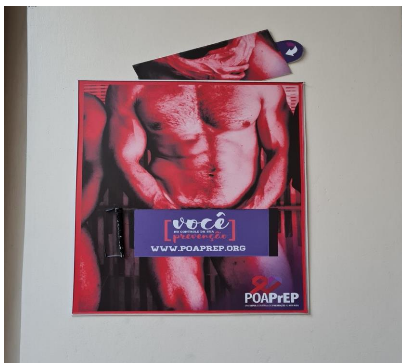
Figura 3. Cartaz do ensaio clínico da PrEP injetável exposto no Instituto de Psicologia da UFRGS.

Depois que li o conteúdo dos cartazes, fiquei empolgado para saber do que se tratava. Naquela ocasião, eu estava acompanhado de uma amiga e um colega, ambos estudavam comigo. A minha amiga que é uma mulher trans e o meu colega, um homem bissexual, também ficaram interessados em saber mais sobre aquela proposta. “Mande uma mensagem para eles”, me disse a minha amiga. Ela estava eufórica. Logo em seguida, enquanto entrávamos no elevador em direção à sala de aula, enviei uma mensagem para o whats do número de telefone que estava no cartaz. Na mensagem, eu falei que estava interessado em saber do que aquilo se tratava. Alguém me respondeu que se tratava da pesquisa de um novo medicamento e que para receber mais informações era só agendar uma visita. Então eu agendei uma visita à clínica do ensaio e informei que levaria uma amiga e um colega que também estavam interessados. Até aquele momento, eu nunca tinha ouvido falar sobre a PrEP, pelo menos não por esse nome.