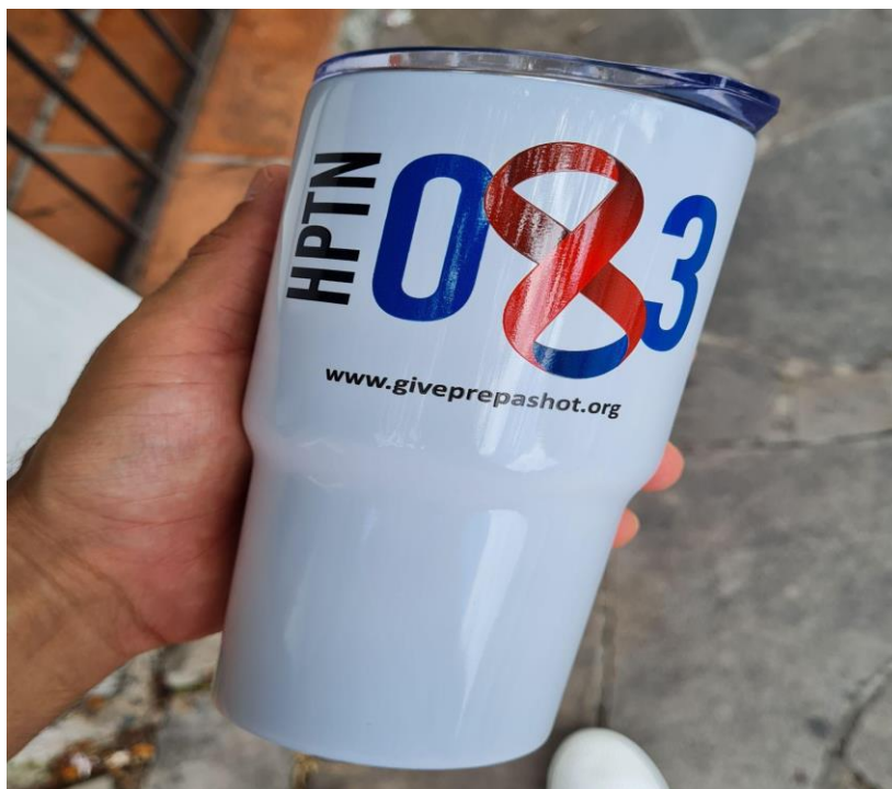
Figura 5. Caneca térmica personalizada que recebi durante uma visita à clínica do ensaio, no dia 13/12/2021.

Dando continuidade às contribuições de Petryna (2009, 2011), os seus trabalhos me provocaram no sentido de questionar o que estava em jogo no HPTN 083. Uma multiplicidade de atores foi mobilizada para realizar o experimento. Dentre eles, estão as empresas terceirizadas para realizar o recrutamento, organizações para administrar os locais da pesquisa, companhias para explorar dados sobre pacientes, comitês de ética de instituições comerciais e públicas, voluntários e voluntárias. Cada um desses atores atribui diferentes sentidos ao experimento e às materialidades nele performadas. No entanto, durante o ensaio, nada se falava sobre a maioria desses atores e sobre seus interesses e objetivos no experimento. Quais foram os sentidos atribuídos pela ViiV Healthcare ? O que os pesquisadores que aderiram à pesquisa em Porto Alegre acharam do experimento? O que realmente estava em jogo? Não que seja o objetivo desta pesquisa responder a todos esses questionamentos, até porque esse não é o propósito desta dissertação. Busco localizá-los por considerar que a autoetnografia que apresento pode acabar explorando pistas interessantes nessa direção, considerando os modos como o cuidado é atuado nesse contexto. Dessa forma, ao criticar as práticas da pesquisa clínica na produção de evidência científica de um medicamento, tenho em vista reconsiderar as noções de ética, cuidado e responsabilidade nas práticas direcionadas ao cuidado em HIV e aids.