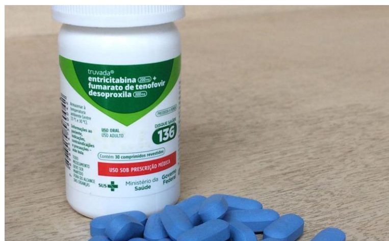
Figura 2. O truvada. Imagem retirada do site Agência Brasil.

Quando entrei para a pesquisa da PrEP, o SUS já havia iniciado o processo de implementação do truvada junto à Comissão Nacional de Incorporação de Tecnologias (CONITEC) 17 , no final de 2017. Logo em seguida, no início de 2018, a versão oral passou a ser ofertada e distribuída em alguns serviços de saúde. As populações designadas como prioridade para PrEP foram: gays e outros HSH, pessoas trans, profissionais do sexo e “parcerias sorodiscordantes”.