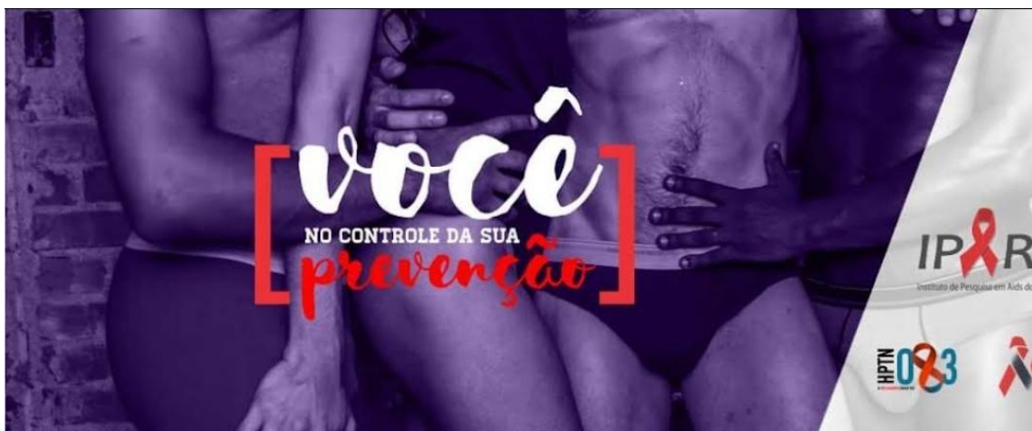
Figura 4. Slogan da campanha publicitária do ensaio da PrEP injetável em Porto Alegre.

Após quase dois anos da minha inclusão no ensaio da PrEP injetável, em uma das minhas visitas à clínica do experimento, percebi que as informações da campanha POAPrEP haviam sido retiradas da fachada do prédio onde a pesquisa foi realizada, dando lugar às informações do IPARGS. Isso pode ter acontecido porque o recrutamento dos sujeitos de pesquisa havia acabado, o que sugere que o processo que estabilizou a PrEP injetável como eficaz e segura para a prevenção começava a se concretizar. Diferentes materialidades entravam e saíam de cena 29 .